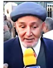
بقلم نجيم عبد الإله السباعي

وأخبر وكما جاء في عنوان مقالي لعل الكارثة تحيي الضمائر الميتة والأصح تحيي الضمائر لأنها فعلا ميتة... واتمنى أن اسمع قريباً ( التخطيط الخماسي، للنهوض بالجماعات الجبلية